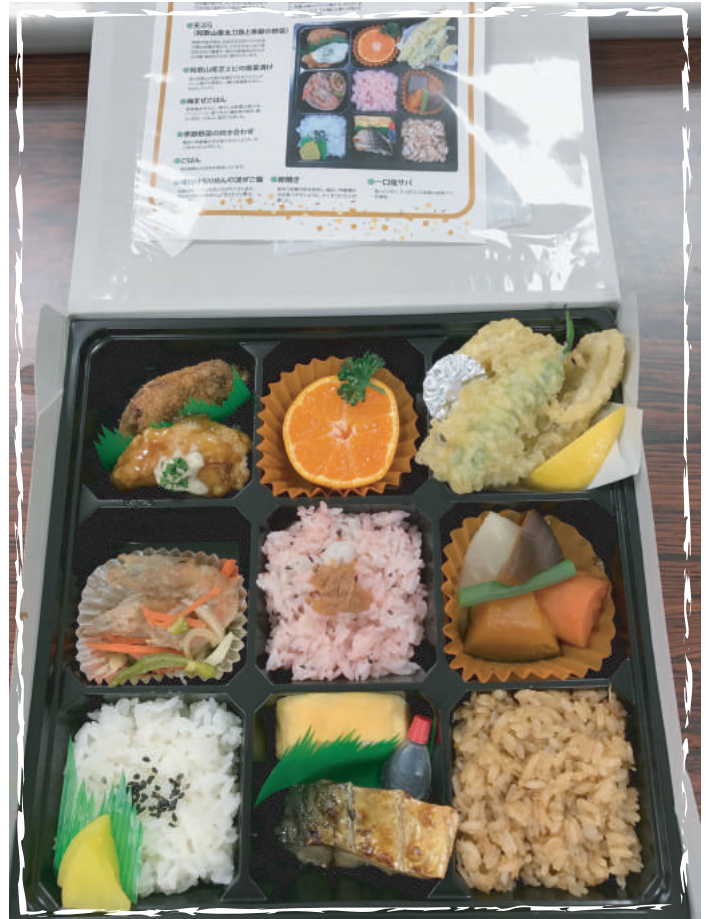
2017年度食祭にて認定された「御三家 紀州弁当」 〈和歌山食材メニュー〉 ごさんげ きしゅうべんとう ・和歌山産マグロのメンチカツ・和歌山産うめどりのチキン南蛮・和歌山産みかん ・天ぷら(和歌山産太刀魚&季節の野菜)・和歌山産芝海老の南蛮漬(梅混ぜ ごはん(和歌山産南高梅使用)・地元和歌山のお米・味付けちりめんの混ぜごはん (和歌山産しらす使用)・卵焼き(紀州ウメドリの卵使用)・一口塩サ・(和歌山産真鯖使用)